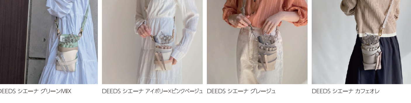
DEEDS シエーナ グリーン/MIX DEEDS シエーナ アイボリー×ピンクページ DEEDS シエーナ グレージュ DEEDS シエーナ カフェオレ

身に着けるだけでコーデをアップグレード。機能性のみならず、デザイン性にも優れています。