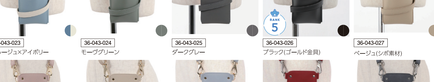
36-043-028 ピンク(シボ素材) 36-043-029 ミルクラテ 36-043-030 ペールブルー 36-043-031 チェリーレッド 36-043-032 ブルーグレー