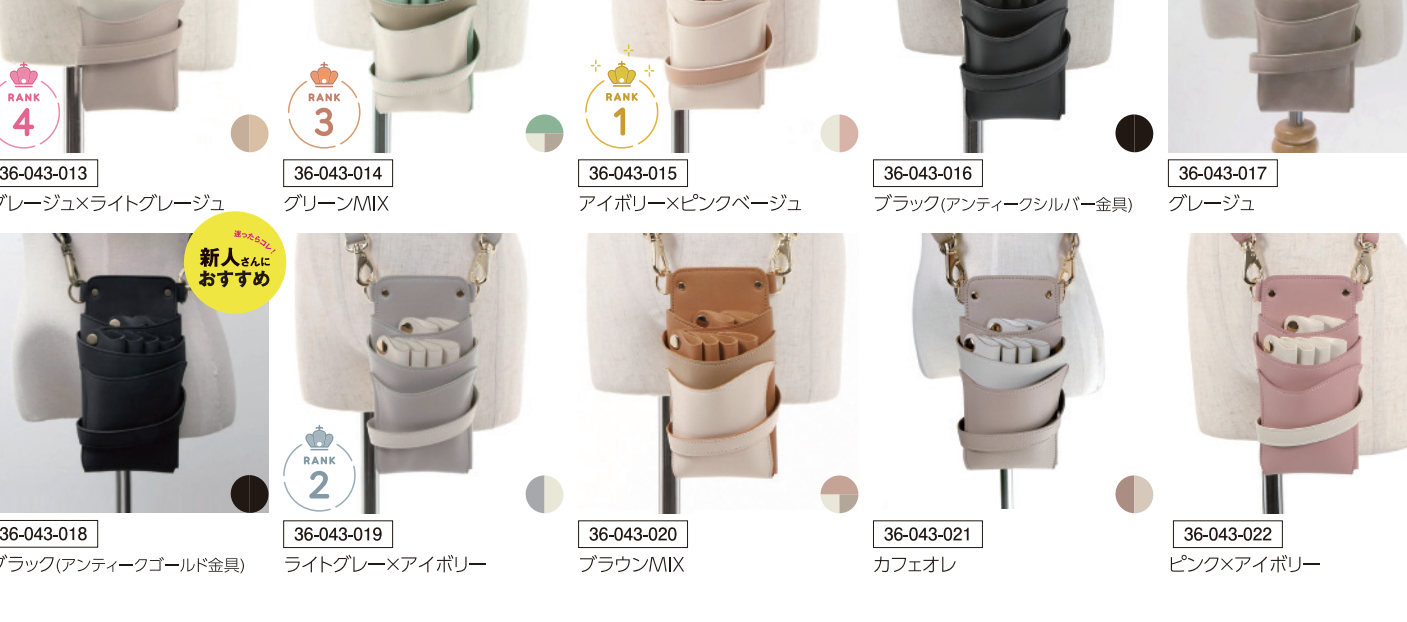
36-043-013 グレージュ×ライトグレージュ 36-043-014 グリーン/MIX 36-043-015 アイボリー×ピンクページ 36-043-016 ブラック(アンティークシルバー金具) 36-043-017 グレージュ 36-043-018 ブラック(アンティークゴールド金具) 36-043-019 ライトグレー×アイボリー 36-043-020 ブラウンMIX 36-043-021 カフェオレ 36-043-022 ピンク×アイボリー

弊社人気No.1!!後列のシザーホルダーが1丁ずつ取り外しできるので、アシスタントからスタイリストまで長くお使いいただけます。