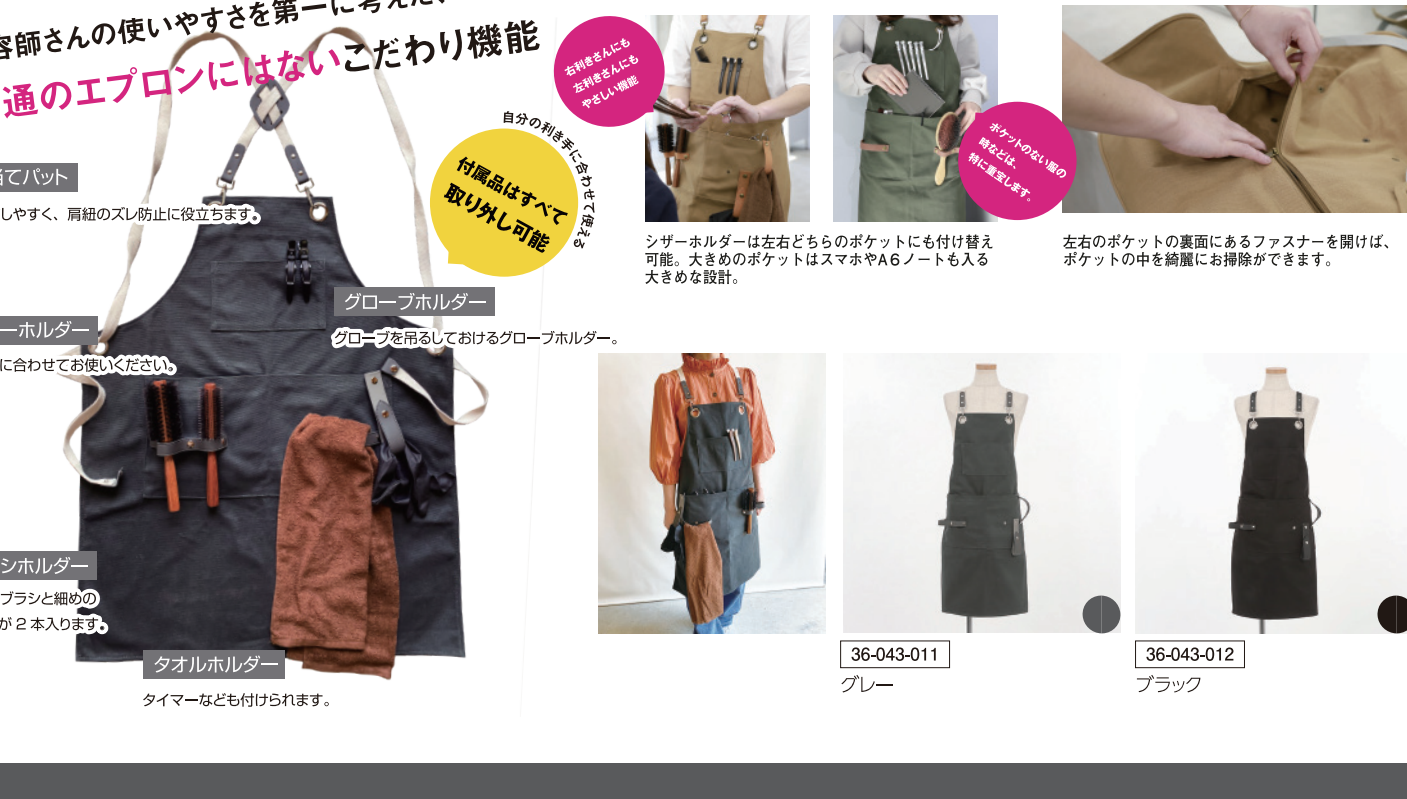
36-043-011 グレー 36-043-012 ブラック