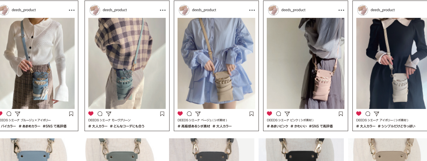
36-043-023 ブルー×アイボリー 36-043-024 モーヴグリーン 36-043-025 ダークグレー 36-043-026 ブラック(ゴールド金具) 36-043-027 ページ(シボ素材)