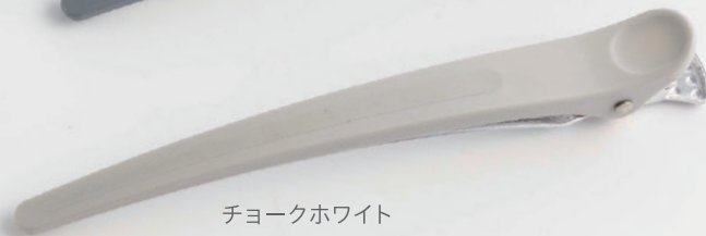
チョークホワイト