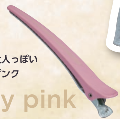
甘さ控えめ大人っぽい ダスティーピンク