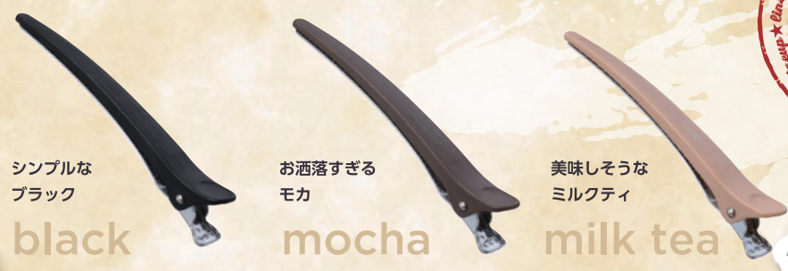
シンプルな ブラック