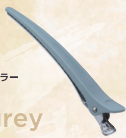
絶妙なエモカラー アイスグレー