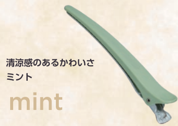
清涼感のあるかわいさ ミント