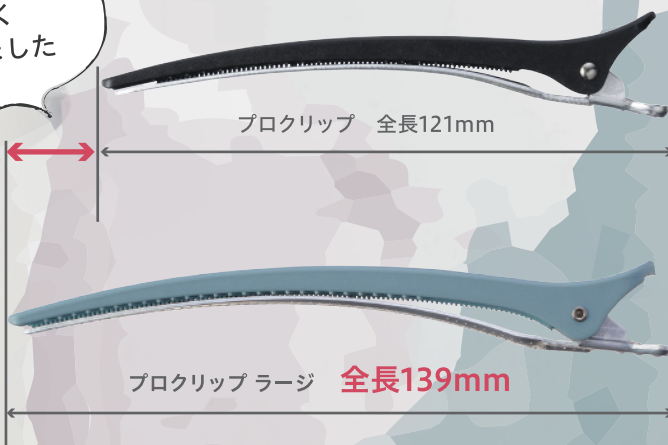
プロクリップ 全長121mm