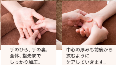
手のひら、手の裏、全体、指先までしっかり加圧。