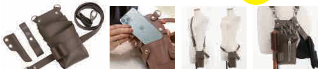
DEEDS U-REALM オリジナルコラボケース