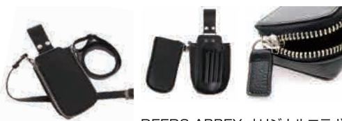
DEEDS ABBEY オリジナルコラボケース