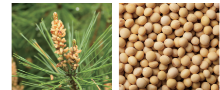
西洋アカマツエキス ダイズエキス

In-cosmeticsのイノベーションアワードにて銀賞(2014年)を獲得した、西洋アカマツエキスなどから成る植物成分※3配合。ダイズエキス※4(イソフラボン含有)配合で頭皮にうるおいを与えます。