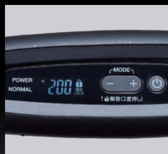
スピード立ち上がり

耐熱フェルトをプレート両端部までしっかりと巻き込んでいるので、根元までしっかり施術が可能です。