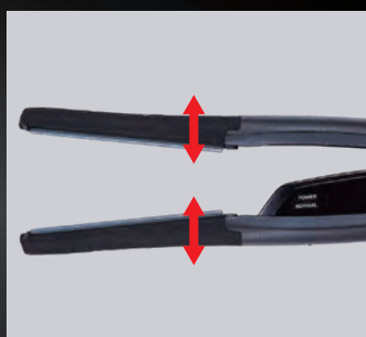
新フロートプレート設計

スリムプレートだからショートのお客様でも施術やすく、縮毛矯正のレタッチ施術にも便利です。