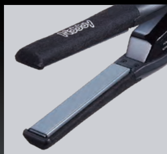
髪の毛の根元から しっかり攻められる設計！

両面フロートプレート構造によりキャッチ性能を大幅アップ。細いスライスにニュアンスを付けたいメンズショートアレンジにおいて、更に施術しやすくなりました。