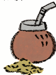
マテチャ葉エキス※4