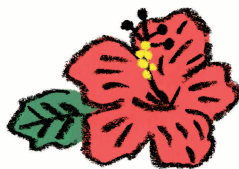
ハイビスカス花エキス※4