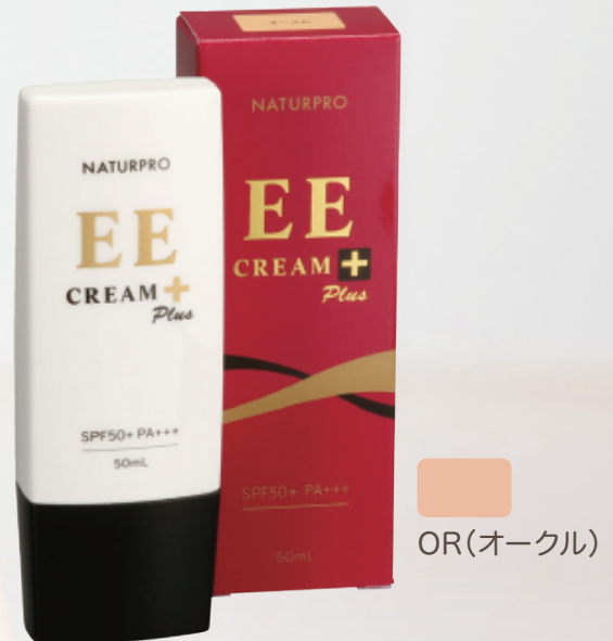
ナチュラルプロ EE クリームプラス 50mL 4,180 円 (税抜価格 3,800 円、税 380 円)