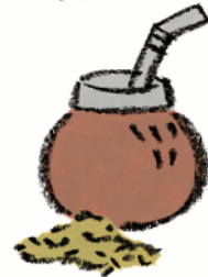
マテチャ葉エキス※4