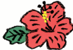
ハイビスカス花エキス※4